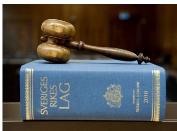
AKTIEBOLAGSLAGEN Rättigheter och skyldigheter Möjligheter