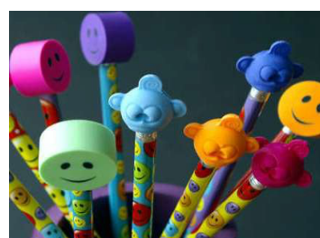
STYRELSENS ARBETE Möteteknik Gruppdynamik Roller